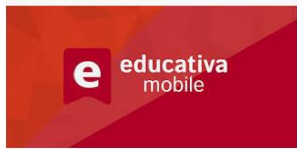
Educativa Mobile - Apps en Google Play play.google.com