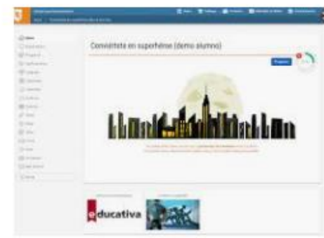
Campus | educativa educativa.com