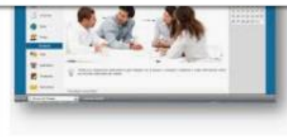
Entorno colaborativo. Herramientas y ... educativa.com